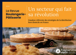
La Revue Boulangerie- Pâtisserie