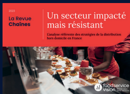
La Revue Chaînes