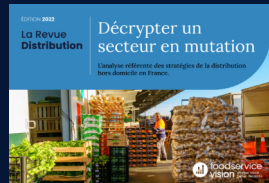
La Revue Distribution