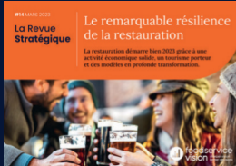
La Revue Stratégique