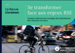
La Revue Livraison