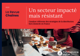
La Revue Chaînes