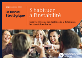
La Revue Stratégique