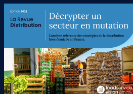
La Revue Distribution