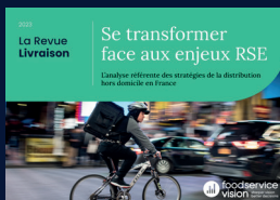
La Revue Livraison