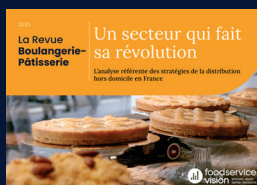
La Revue Boulangerie-Pâtisserie