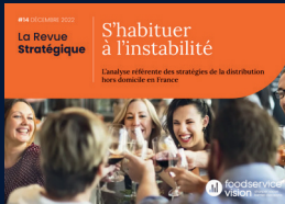
La Revue Stratégique