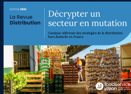
La Revue Distribution