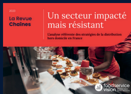
La Revue Chaînes