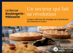
La Revue Boulangerie-Pâtisserie